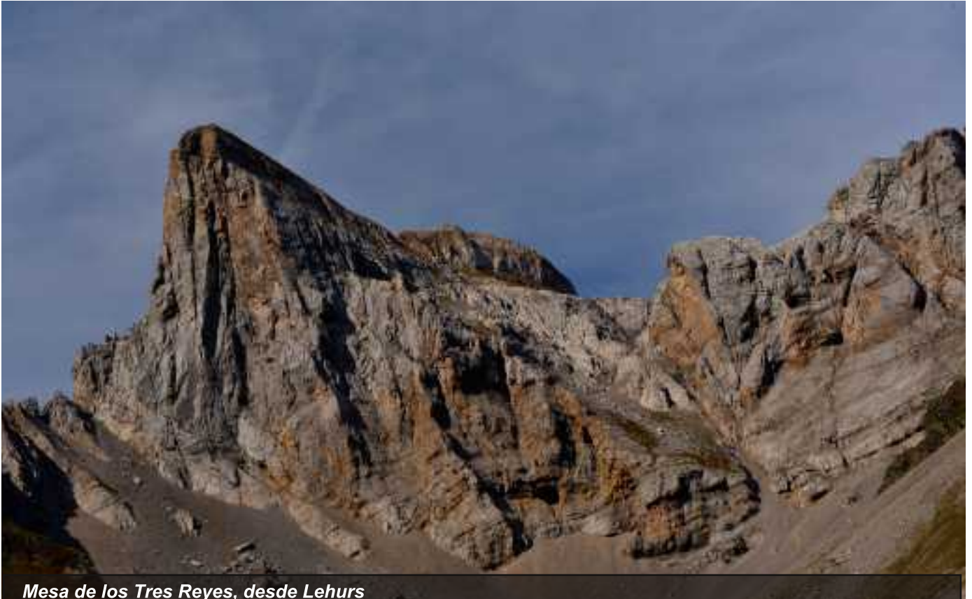
Mesa de los Tres Reyes, desde Lehurs

mirada. Ver la proa de LA MESA reflejada en el lago de LHURS impresiona, es majestuosa. Su cumbre es siempre especial, la comparto con otro montañero, saboreo las vistas en todas direcciones, paso lista MIDI, ATXERITO... están todos, miro al ANIE, con agradecimiento, como ayer miraba a LA MESA desde el ANIE con incertidumbre. En la cara N del BUDOGIA varias manadas de sarríos, alegra la caminata ver animales en libertad. Bajo al PORTILLO DE LARRA y cojo carrerilla para subir LA PAQUIZA. Después de la cresta hacia PEÑA DEL REY, abierta con vistas en todas direcciones, el introducirme en el bosque de LINZA es como entrar en otra dimensión de silencio y paz.