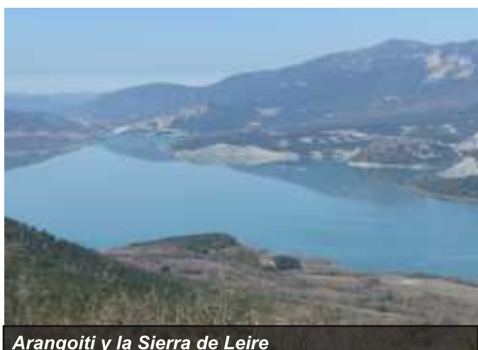
Arangoiti y la Sierra de Leire