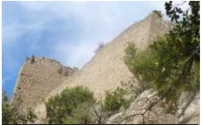
Castillo de Roita