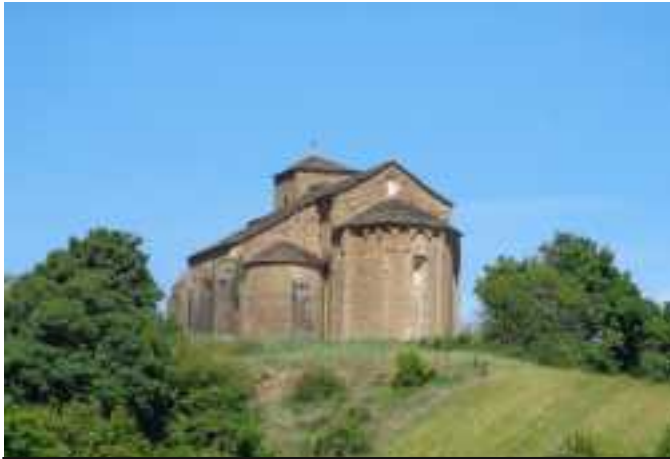
Ermíta románica de Baques (s. XI)