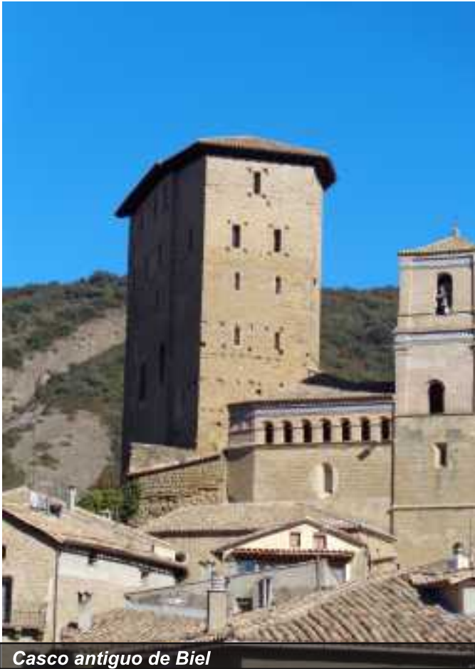
Casco antiguo de Biel