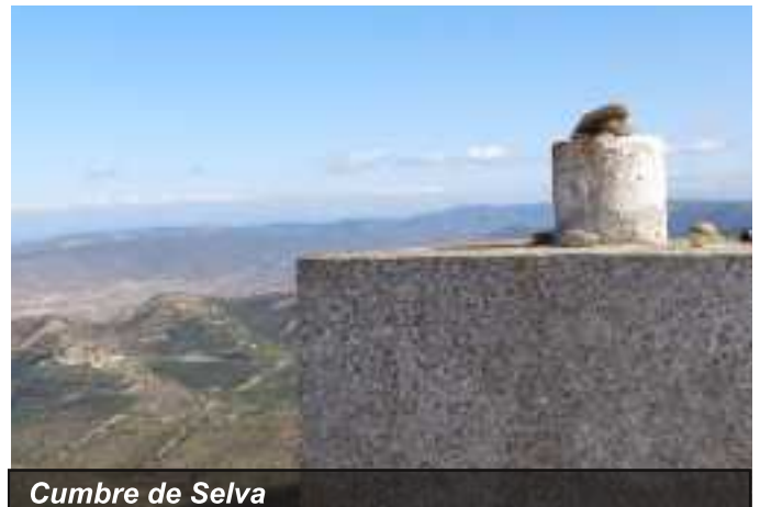
Cumbre de Selva