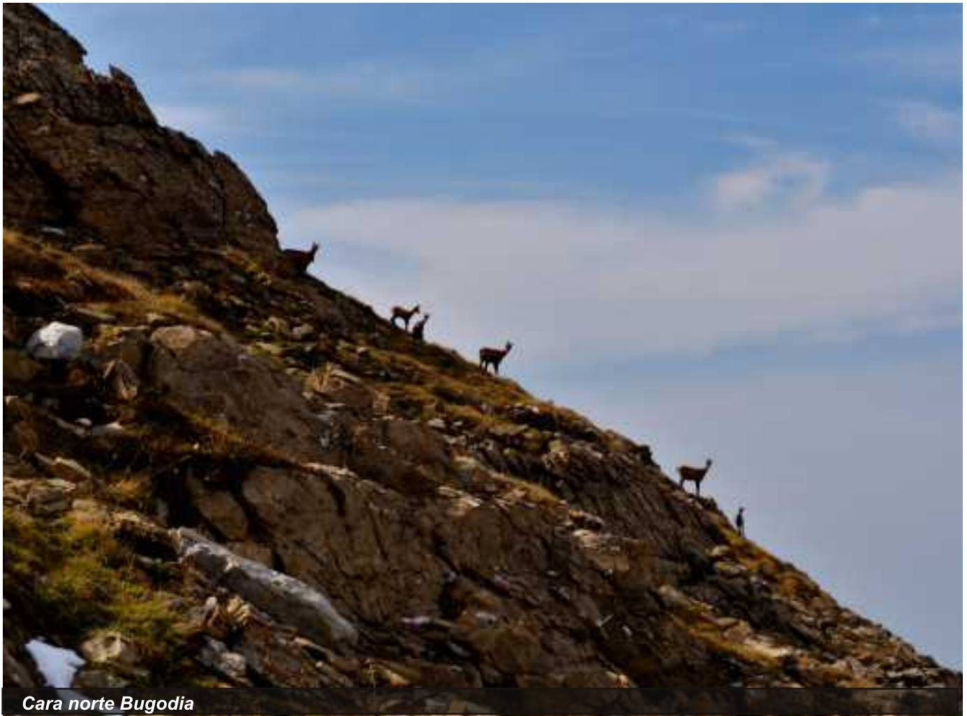
Cara norte Bugodia

No hay TV y las camas son de madera, pero con el Anie y el Txamantxoia, me siento como en casa