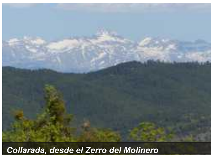
Collarada, desde el Zerro del Molinero