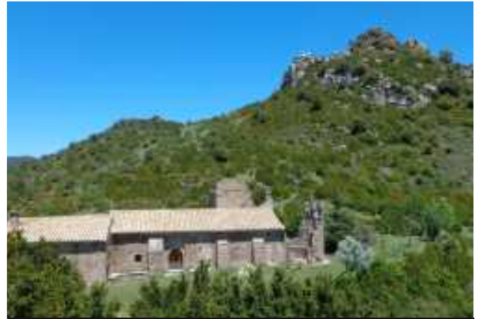
San Miguel de Liso y Puntal de Poueluza